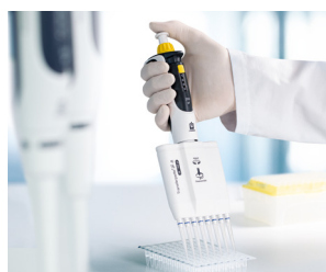
Trabajar con placas PCR