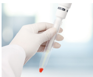
Tubos de centrifuga estrechos

Los vástagos y juntas individuales se desenroscan fácilmente y permiten limpiarlos o sustituirlos sin dificultad