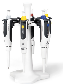
Fig. Paquete de pipetas 2