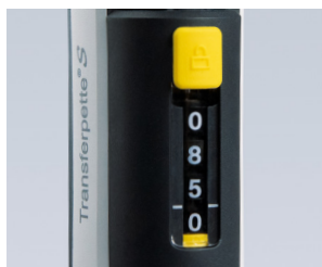
Protección contra el cambio de volumen