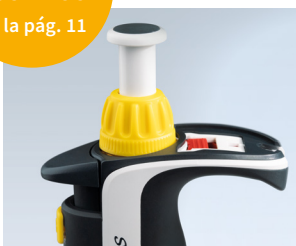
Técnica Easy Calibration