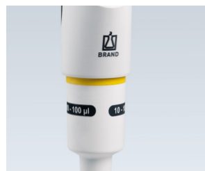
Acoplamiento del vástago integrado