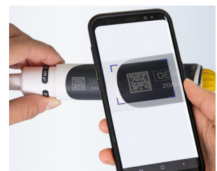
Documentación del producto